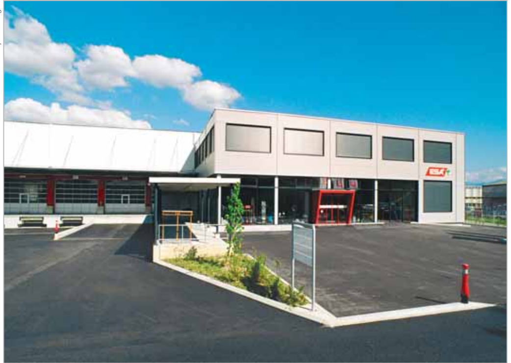
Accès principal du site ESA