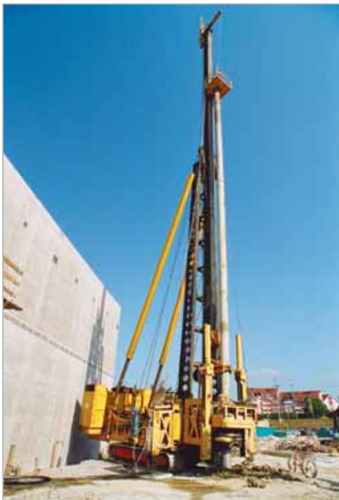
Exécution de pieux forés