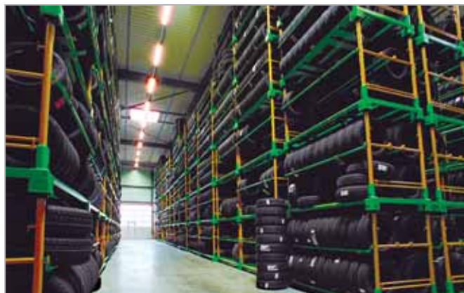
Halle "A" de stockage