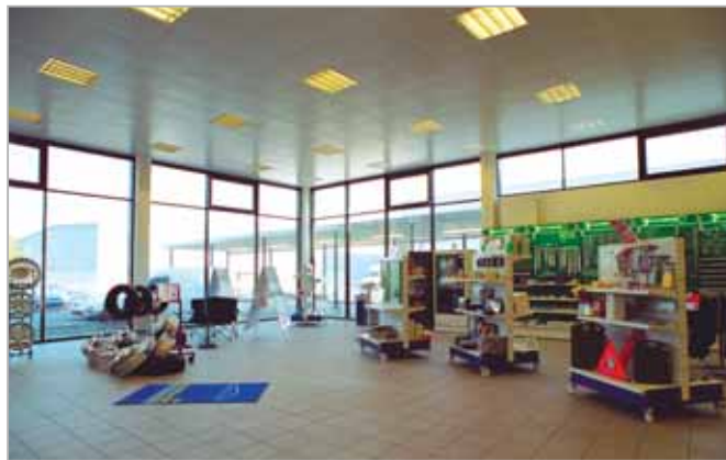
Surface de Vente