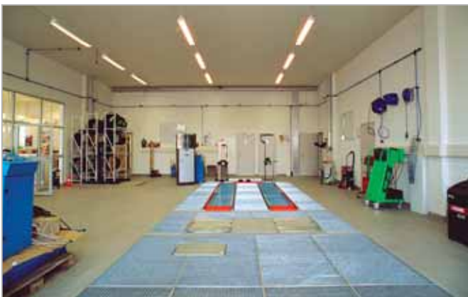
Local de démonstration

En complément au large assortiment de produits, ESA propose des prestations de service qualifiées et professionnelles, tels que conseils, planifications, études de projets, financement et formations, mais aussi un service de commande 24 heures sur 24 avec des livraisons journalières.