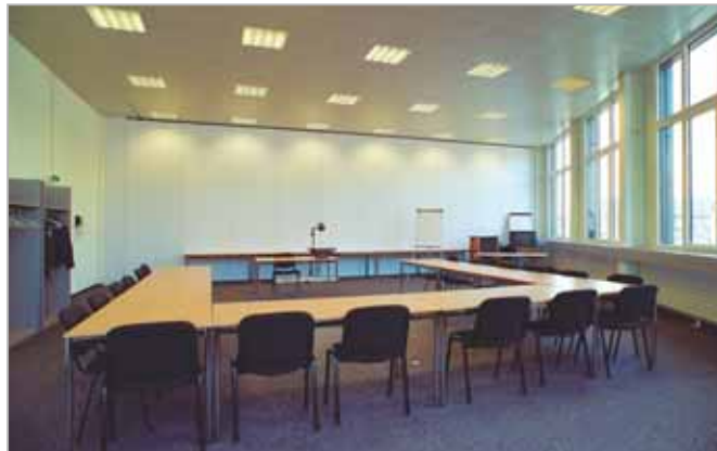
Salle de conférences