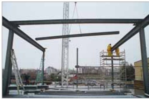
Pose de profilés métalliques