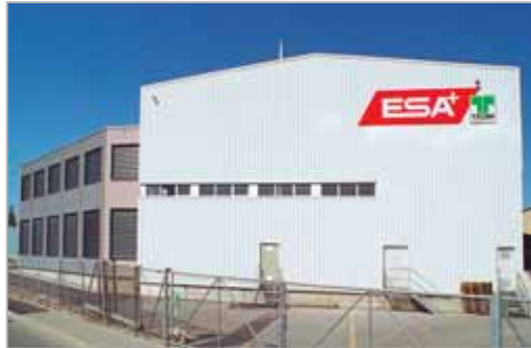
Administration et Halle "C"