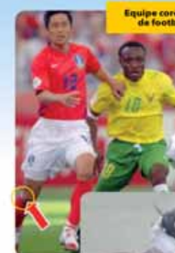
Equipe coréenne de football

Des athlètes de haut niveau les utilisent pour augmenter l'endurance, force musculaire, énergie, récupération, concentration, souplesse.