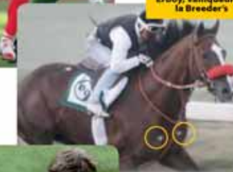
Erboy, vainqueur de la Breeder's