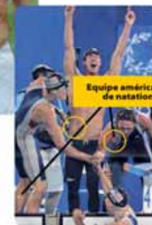
Equipe américaine de natation

Renseignements et rendez-vous par mail: infopatches@gmail.com