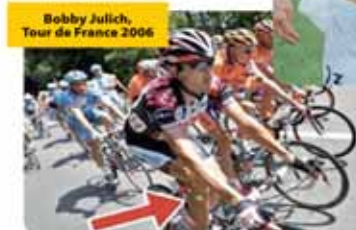
Bobby Julich, Tour de France 2006